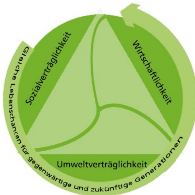
Abbildung 1: Die drei Grundsätze der Nachhaltigkeit

Die Maßnahmen des Konzepts betreffen die Handlungsfelder Beschaffung, Mobilität, Gebäude, Landnutzung, Bildung und Öffentlichkeitsarbeit. Für die Mobilität formuliert die Landeskirche folgende Ziele: Die CO 2 -Emissionen, die durch die dienstliche Mobilität der kirchlichen Mitarbeitenden entstehen, sollen deutlich reduziert werden, nämlich um 20 % bis 2018, um 50 % bis 2030 und um 80 % bis 2050 (Vergleichsjahr ist 2015). Seit Anfang 2016 vergütet die Landeskirche Dienststrecken, die mit Privatfahrrad zurückgelegt werden, mit 10 Cent pro Kilometer. Damit setzt die Landeskirche einen Impuls, der von kirchlichen Institutionen genutzt werden kann, um mobilitätsbedingte Treibhausgase zu verringern. Diese Arbeitshilfe unterstützt Kirchengemeinden, Einrichtungen und Verwaltungen darin, weitere vielfältige Maßnahmen für eine klimafreundliche Mobilität kennenzulernen und umzusetzen, sich nachhaltig zu verhalten und so ihren Teil zum Klimaschutz beizutragen.